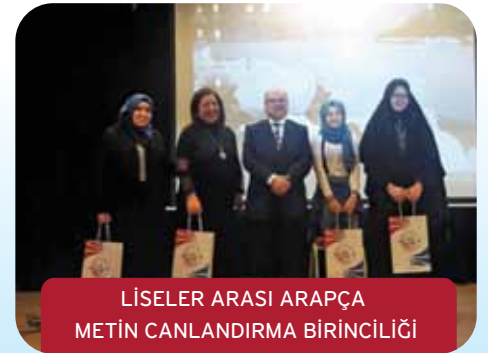
LİSELER ARASI ARAPÇA METİN CANLANDIRMA BİRİNCİLİĞİ