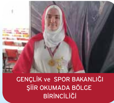
GENÇLİK ve SPOR BAKANLIĞI ŞİİR OKUMADA BÖLGE BİRİNCİLİĞİ