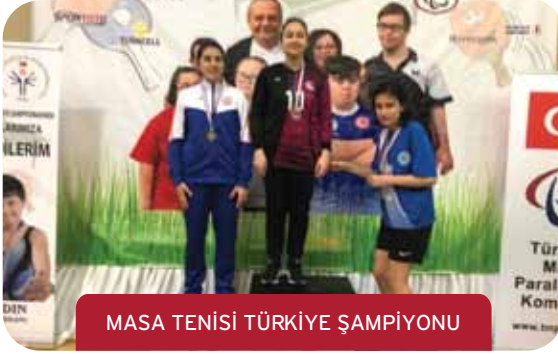
MASA TENİSİ TÜRKİYE ŞAMPİYONU