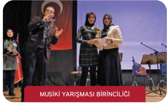
MUSİKİ YARIŞMASI BİRİNCİLİĞİ