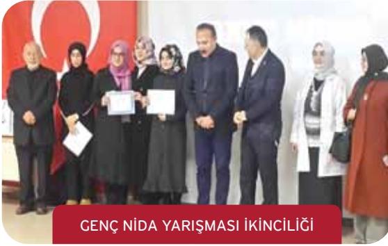
GENÇ NİDA YARIŞMASI İKİNCİLİĞİ