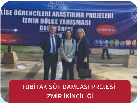
TÜBİTAK SÜT DAMLASI PROJESİ İZMİR İKİNCİLİĞİ