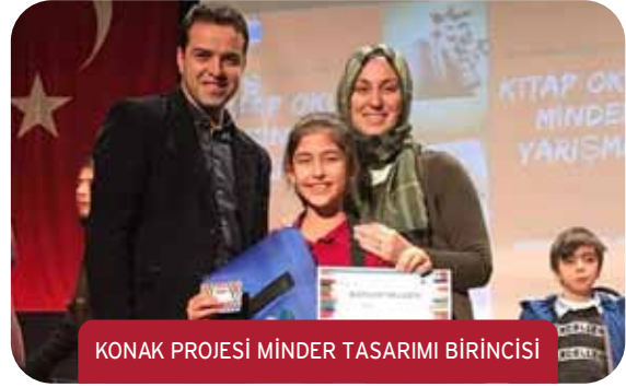
KONAK PROJESİ MİNDER TASARIMI BİRİNCİSİ